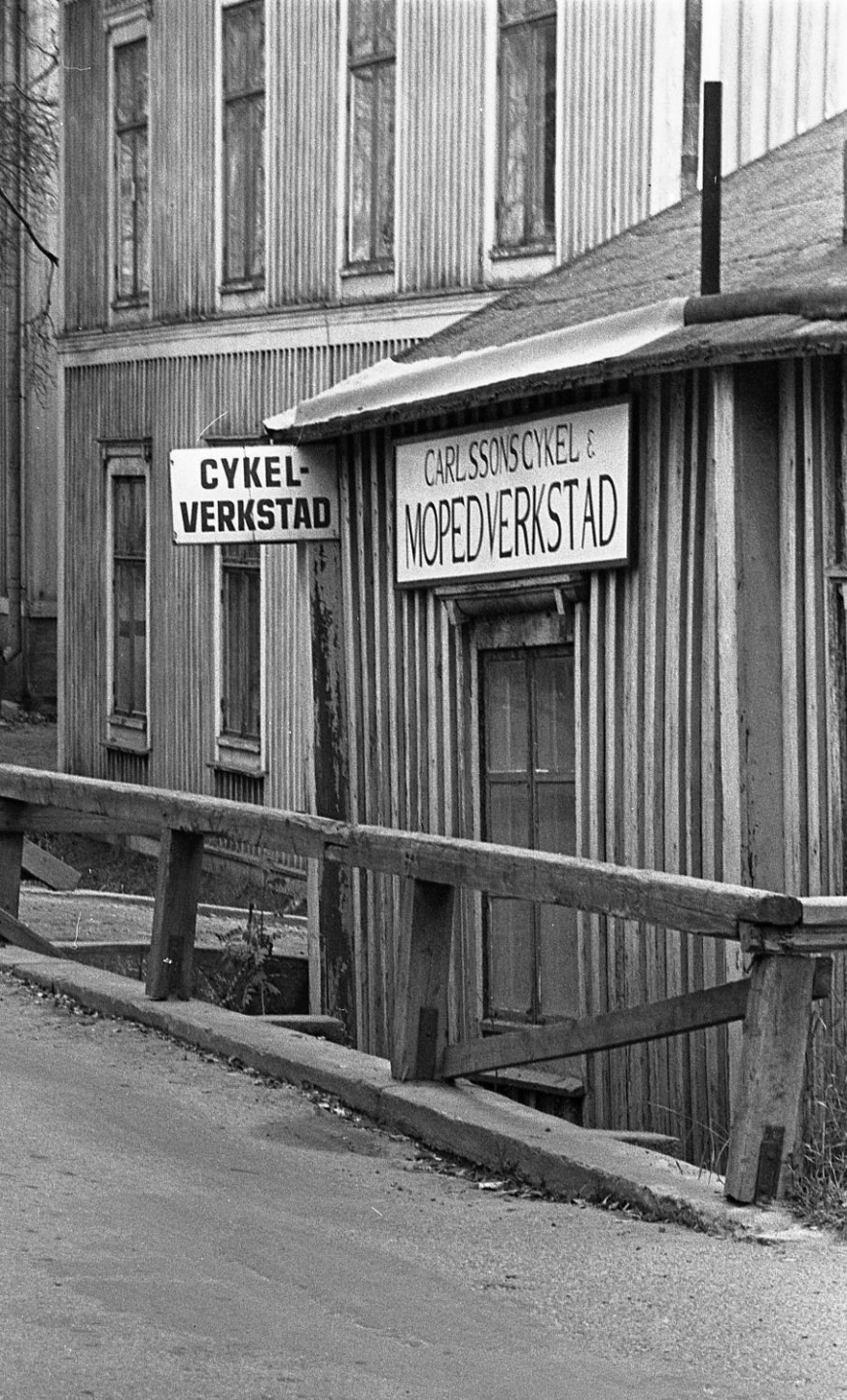
Carlssons Cykel och Mopedverkstad i kv. Karpen