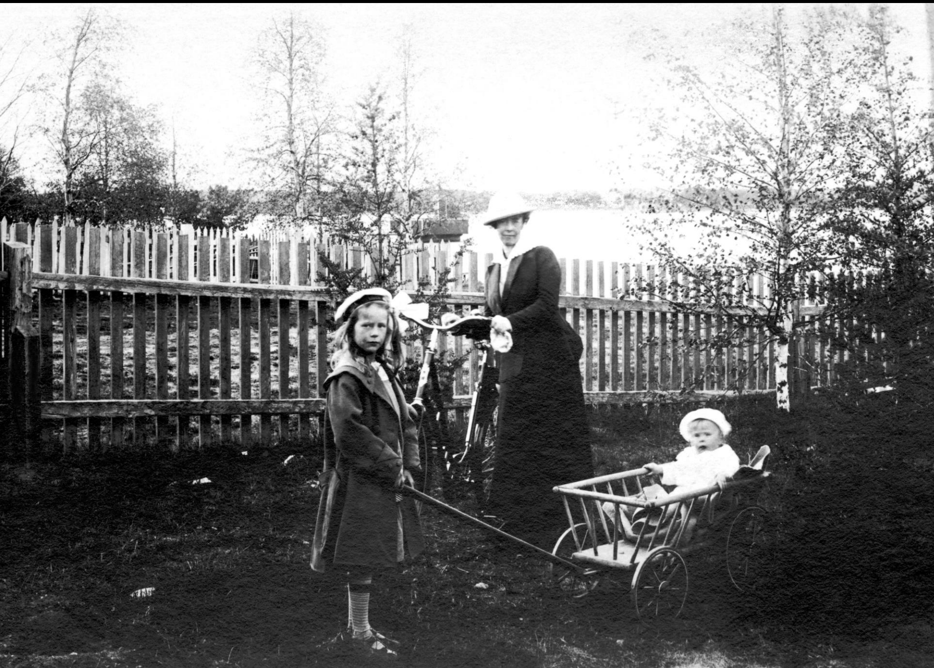
Kvinna med cykel och flicka med barnskrinna.