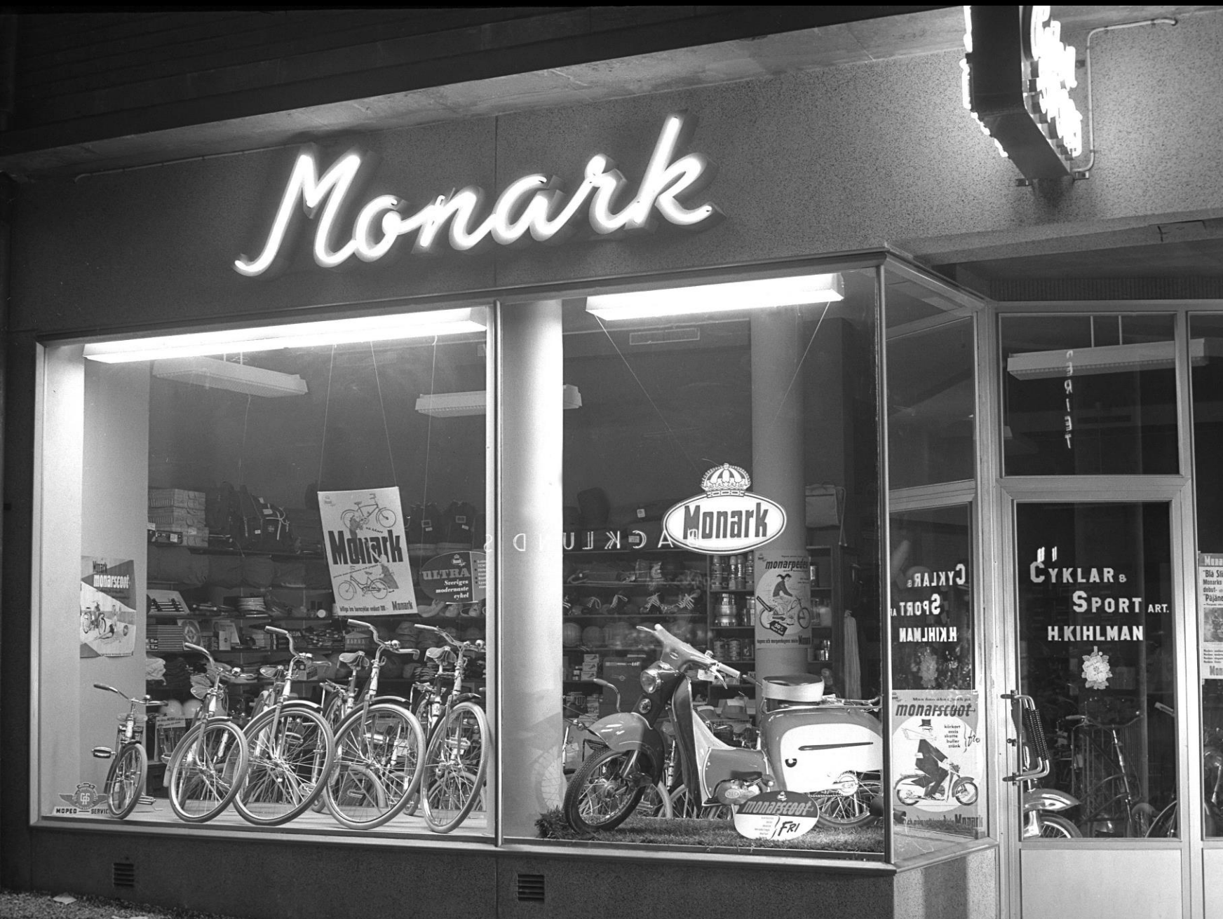
Cykel & Sportaffären H Kihlman på Kungsgatan.