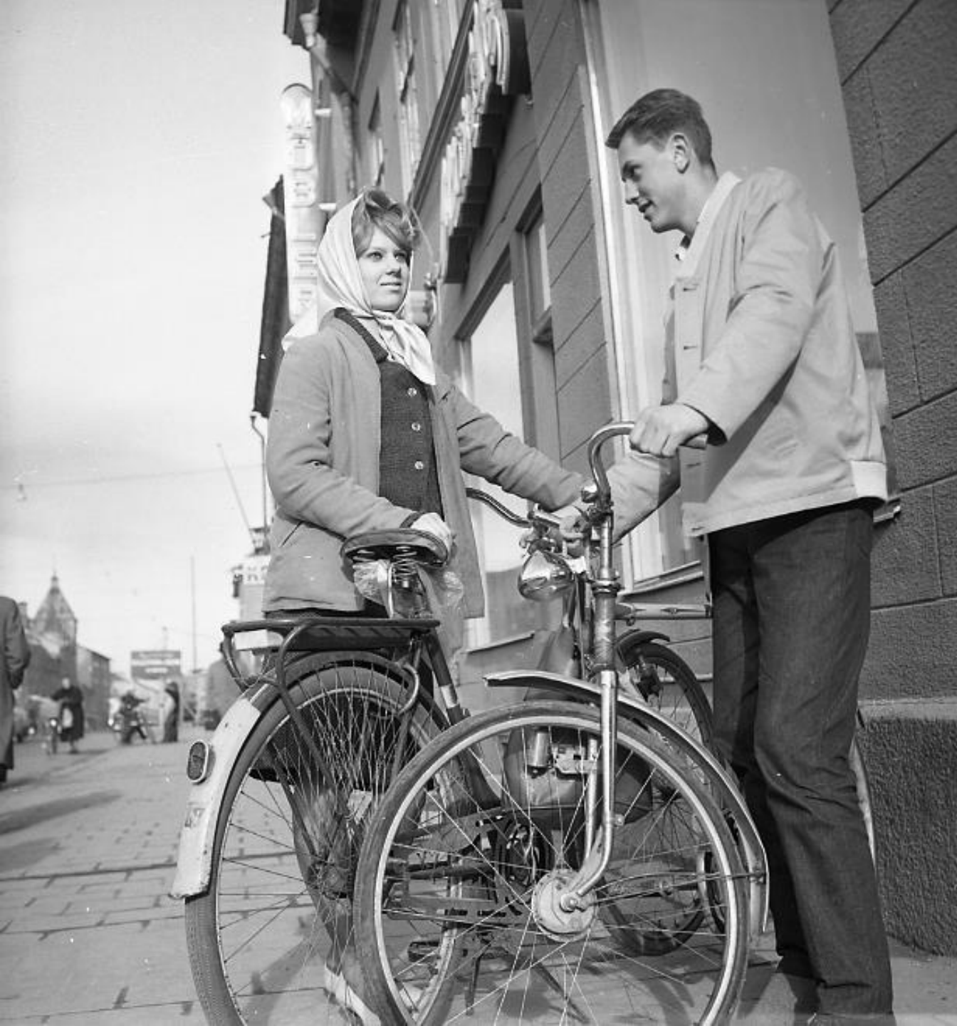
Två cyklister från 60-talet i Luleå centrum