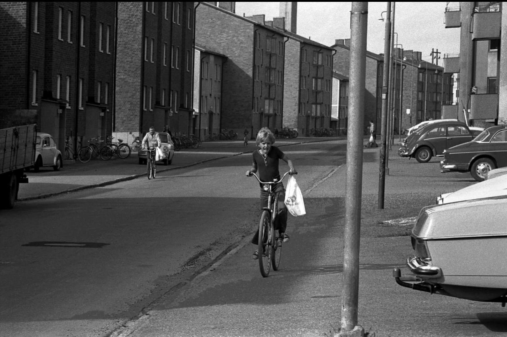
Pojke som cyklar efter Edeforsgatan, Örnäset.