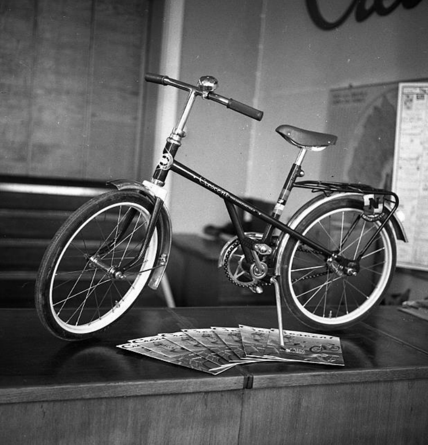
Lycko-vinst (barncykel). Publicerat i NK 19610318