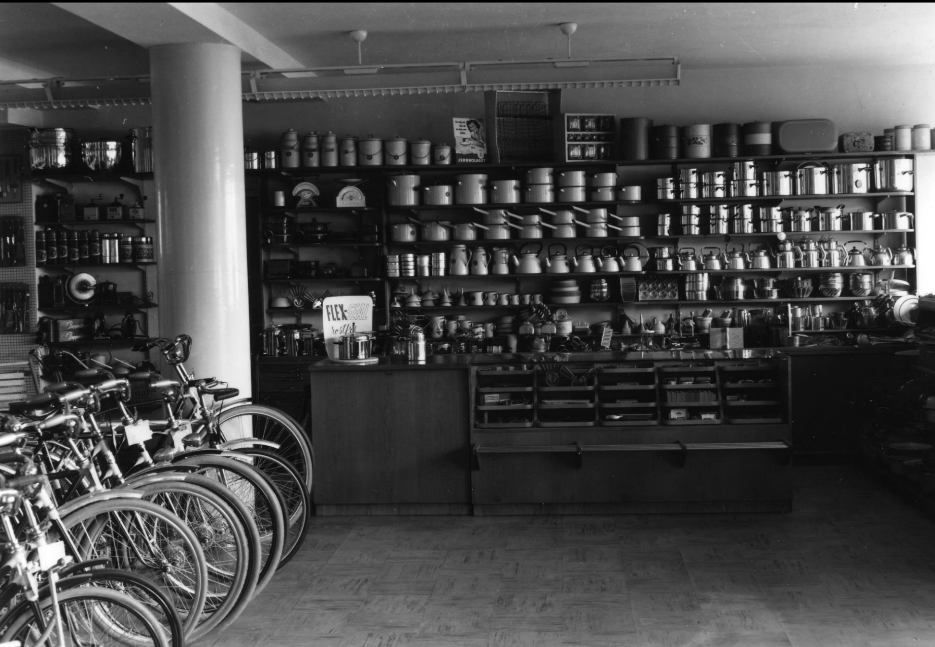
AB Carl Brandfors Järn- & Maskinaffär. Interiörbild av cykel- och husgerådsavdelningen.