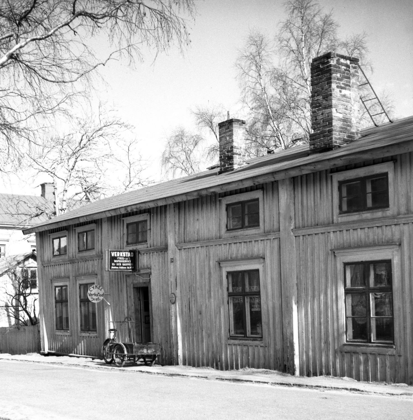
Cykelverkstad vid Köpmangatan, kv Braxen. "Verksked Cykel-och Mopedservice El- och Gassvets"