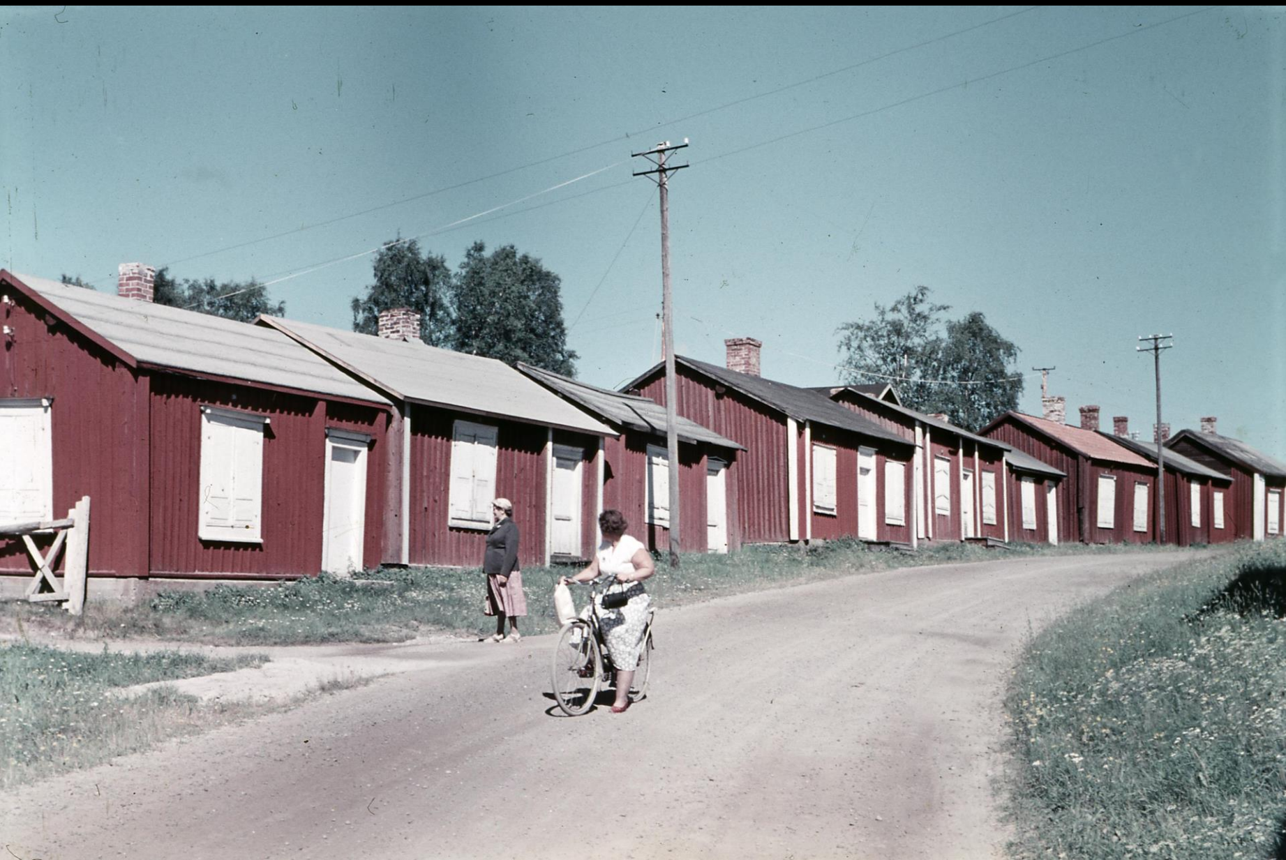
Kyrkstugor i Gammelstad. På vägen framför stugorna två kvinnor, en gående och en på cykel