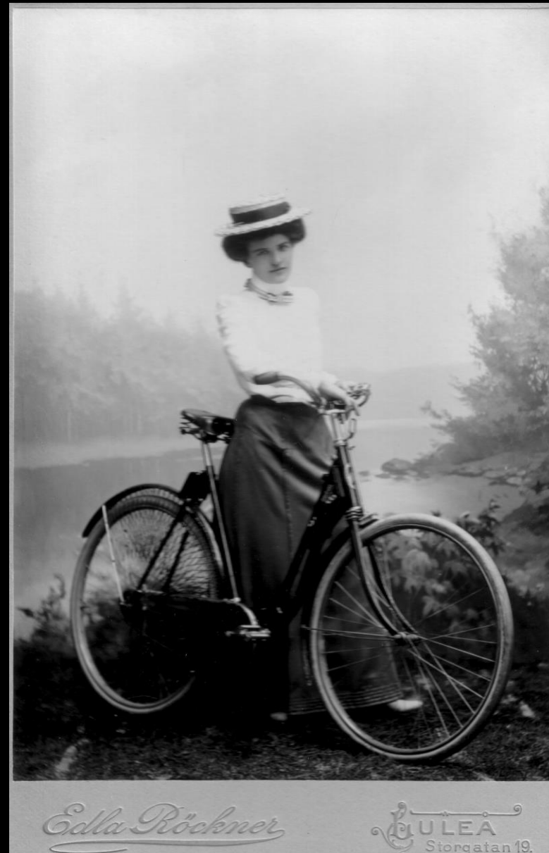
Kvinna med cykel