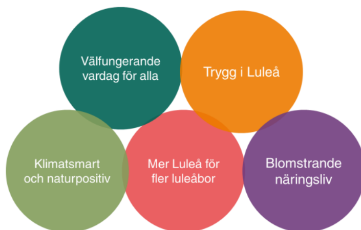
Bild 1: Fem cirklar med rubrik på kommunfullmäktiges fem prioriterade områden.

Luleå kommunkoncern förväntas besluta om målsättningar med utgångspunkt i sina grunduppdrag, för att bidra till kommunfullmäktiges prioriterade områden och tilläggsuppdrag (se bild 1). Varje prioriterade område har en koppling till de övergripande målen, Agenda 2030 och 2024 års sex initiativ.